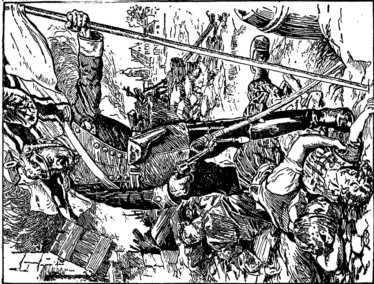
„Kulturträger“ w Polsce w czasie wojny — (Z niewiśniętego filmu w Gliwicach)